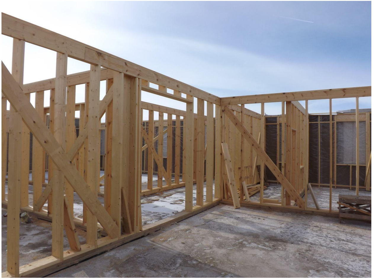
Alle veggene i den første etasje er montert.